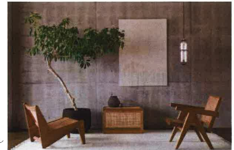
家具: ジャンヌレ PH59、PH29