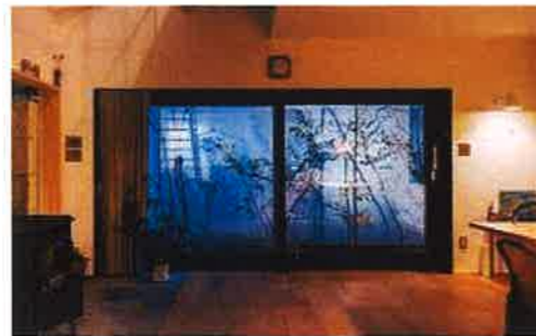
開口部: ユニルクス