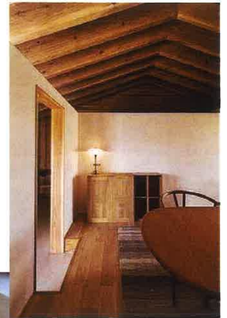
床: 北海道オーク ヘリなしタタミ