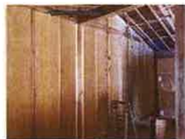
断熱: ウッドファイバー